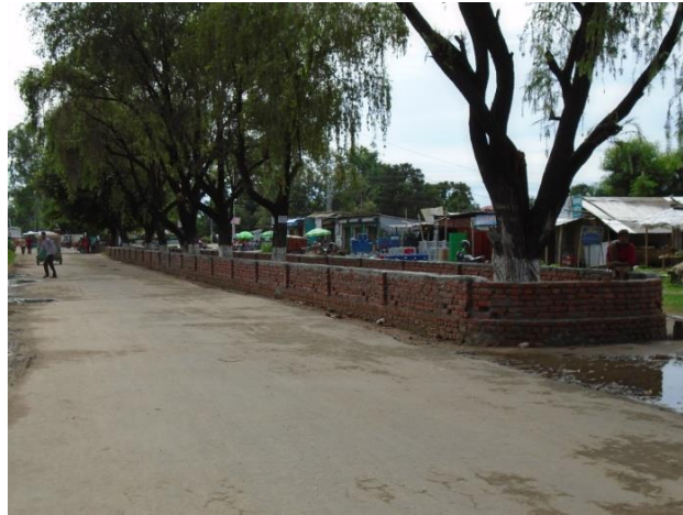
निर्माण चरणको अवस्था