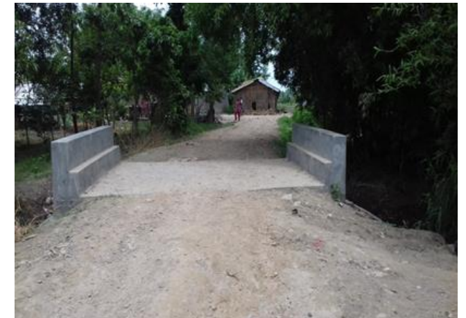
सम्पन्न भए पश्चात्को अवस्था