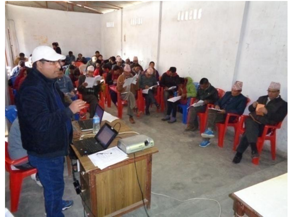
एकीकृत योजना तर्जुमा समितिको बैठक