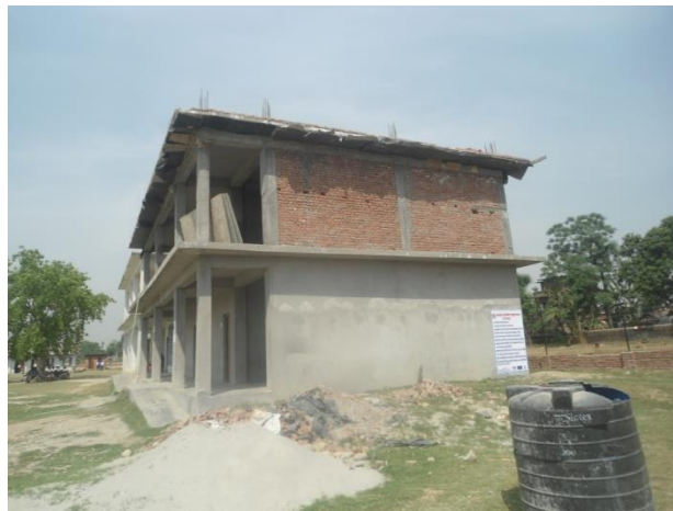
निर्माण चरणको अवस्था