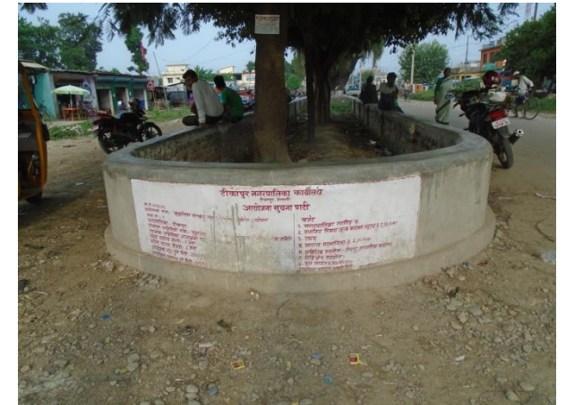
सम्पन्न भए पश्चात् को अवस्था