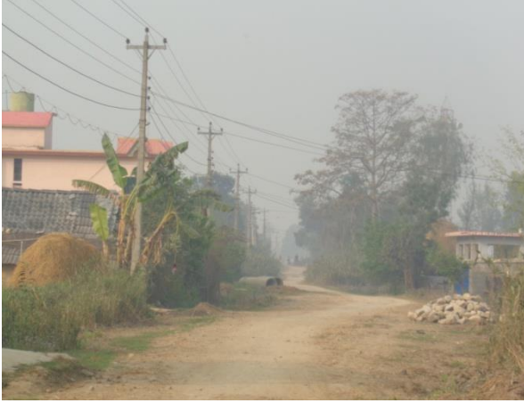
शुरु हुनु भन्दा पूर्वको अवस्था