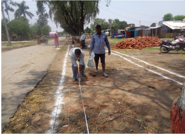
शुरु हुनु भन्दा पूर्वको अवस्था