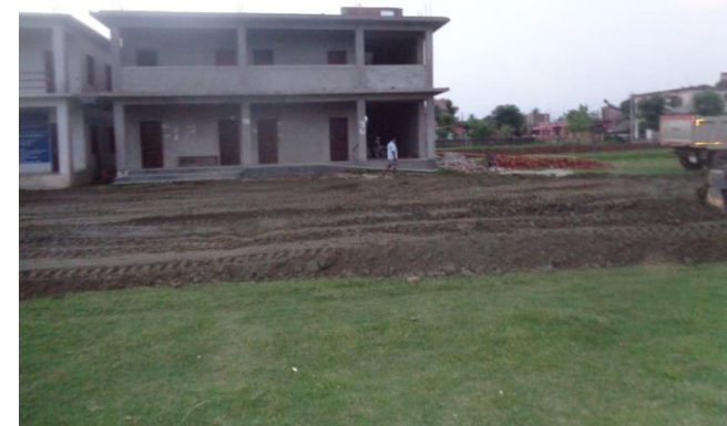
सम्पन्न भए पश्चात्को अवस्था