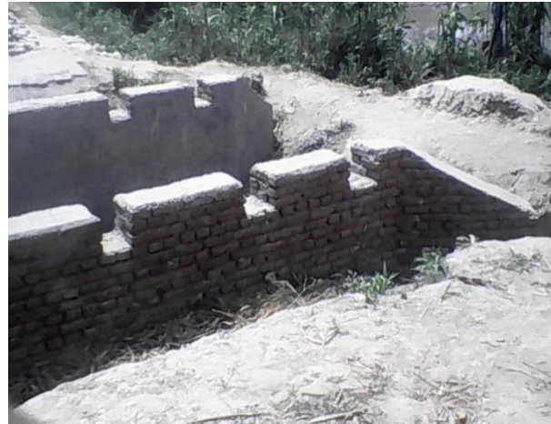
निर्माण चरणको अवस्था