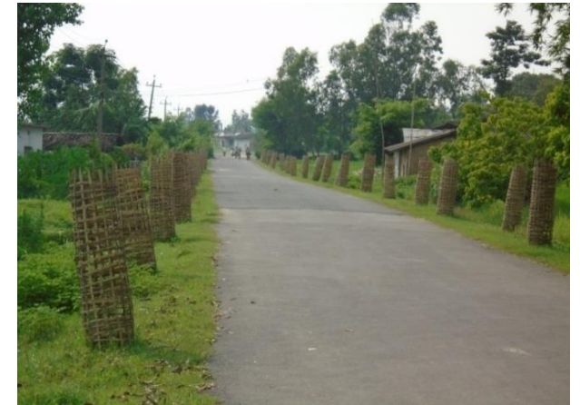
सम्पन्न भए पश्चात् को अवस्था