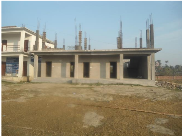
शुरु हुनु भन्दा पूर्वको अवस्था