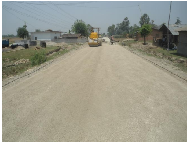
निर्माण चरणको अवस्था