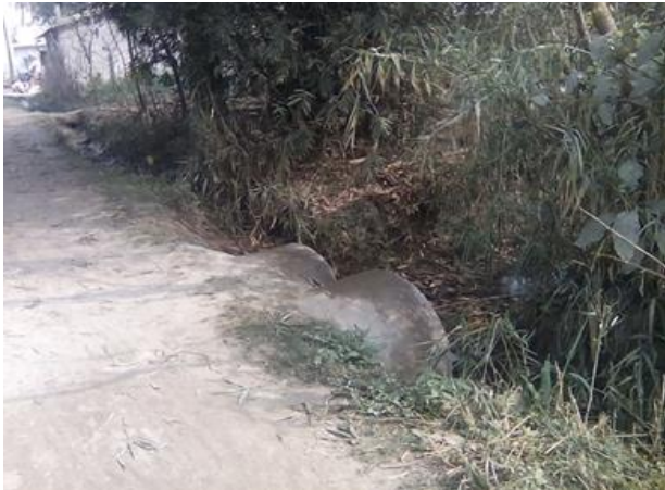
शुरु हुनु भन्दा पूर्वको अवस्था