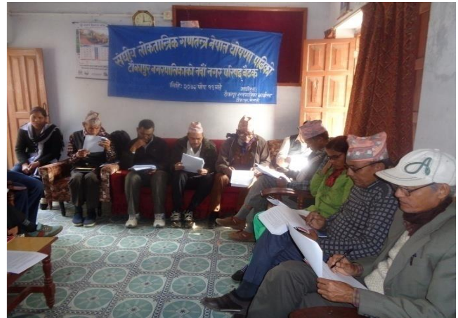
एकिकृत योजना तर्जुमा समिति बैठकका केही भलकहरु