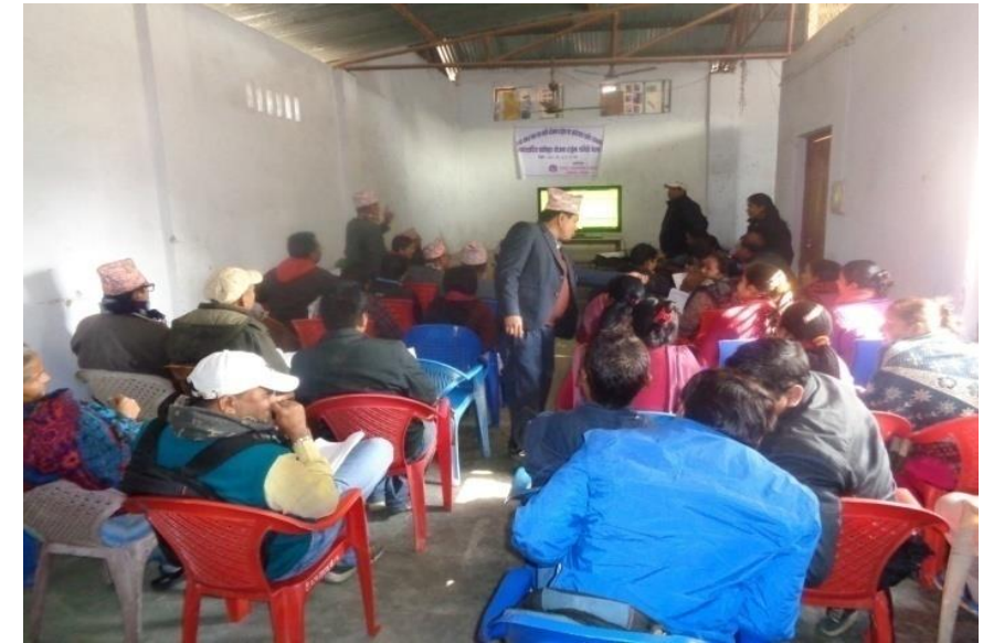
वडा भेलाका केही भलकहरु :